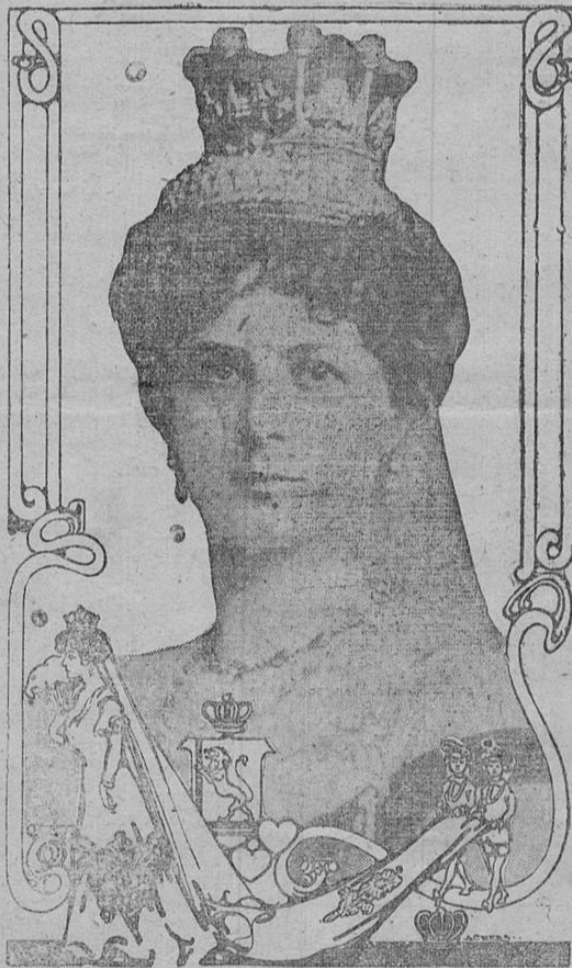
GUILLERMINA, REINA DE HOLANDA.

(AEROGRAMAS RECIBIDO S AYER EN LA MAÑANA) Colón, agosto 5.—11 y 30 a. m. Todo Europa arde en guerra. — Inglaterra, Francia, Rusia, Alemania, Suiza, Holanda, Dinamarca, Turquía y Grecia están bajo las armas. Los aeroplanos y dirigibles están jugando un gran papel en la guerra. Inglaterra ha declarado la guerra a Alemania. El informe de la batalla del mar del norte ha resultado falso. Fracasó un atentado para asesinar al Príncipe heredero de la Corona de Alemania. Suiza está movilizando su ejército para conservar la integridad de su territorio. La situación de Italia es muy seria.—Los industriales y trabajadores amenazan con una revolución si el Gobierno no suspende los preparativos de Guerra. Holanda ha sido invadida por los alemanes. Se ha dado orden de abrir los diques, en Holanda, para impedir la invasión. Un crucero alemán capturó al buque inglés "Magbay". Un acorazado inglés ha salido a toda velocidad para las costas de Méjico, donde un velero y un crucero están amenazados por el mismo buque alemán. Los cruceros alemanes persiguen la flota rusa en el Golfo de Finlandia. La Guerra franco-alemana ha sido declarada oficialmente.