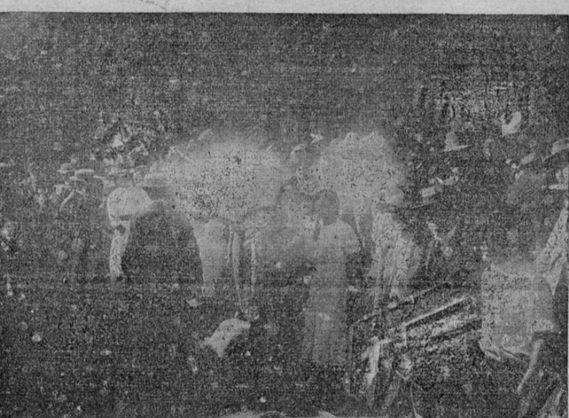
Grupo de señoras y señoritas despidiendo a los reservistas alemanes en la Estación del Atlántico ayer en la mañana

LOS RESERVISTAS ALEMANES QUE SALIERON AYER DE ESTA CAPITAL SE HAN VISTO OBLIGADOS A REGRESAR HOY