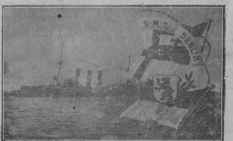
A ULTIMA HORA Y DE COL ON, CONFIRMASE LA NOTICIA DE UNA BATALLA NAVAL EN QUE ALEMANIA PERDIO 7 BUQUES E INGLATERRA 2.