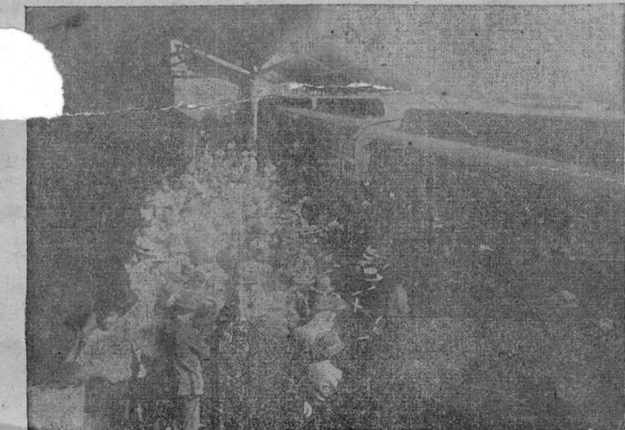
Los reservistas alemanes al tomar el tren.—Público que los despedía.

Ayer partieron los reservistas alemanes para la guerra. Todos los miembros que de la colonia alemana quedan en esta capital, tanto damas como señoras y caballeros, estuvieron en la Estación a despedir a los pa-